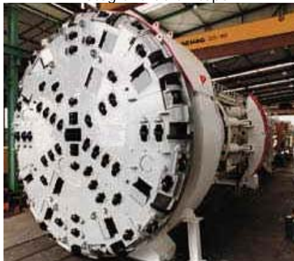
Fotografía de un topo